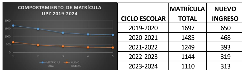
Figura. Estudiantes de nuevo ingreso por ciclo escolar en la UPZ

La UPZ ha presentado una disminución acumulada de matrícula del 35% . Como se puede observar en la siguiente grafica durante el ciclo escolar 2019 – 2020 se atendía una matrícula de 1,697 alumnos y actualmente en el ciclo 2024-2025 se tiene registrado una matrícula de 1,110 estudiantes, lo que representa un total de 587 alumnos menos en las aulas de la UPZ.